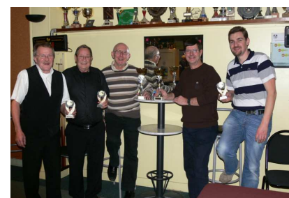
Les finalistes des deux tournois