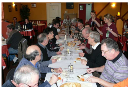
Un grand moment du tournoi

Le tournoi interne de 5 quilles s'est déroulé le samedi 29 janvier. 24 compétiteurs se sont retrouvés rue Béranger, certains avec la volonté affichée de gagner d'autres plus modestement pour passer une journée agréable entre copains. Bien sûr, ceux qui voulaient gagner n'ont pas tous réussi, mais par contre ceux qui voulaient passer une bonne journée ont atteint leur objectif.