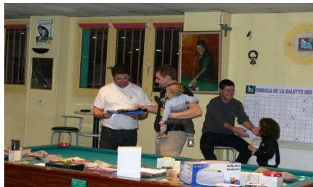
Tirage de la tombola