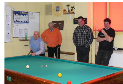
Sérieux mais décontractés

Ce qui est sûr c'est que tous les joueurs se sont accrochés, ce qui nous a valu de terminer les poules à 17h.