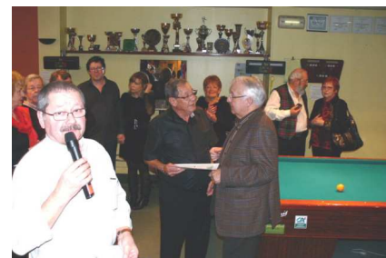
Remise des diplômes