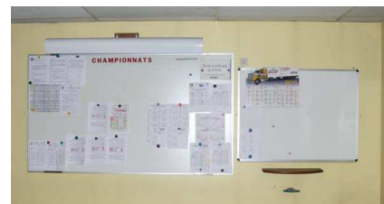
Compétition à gauche Formation à droite