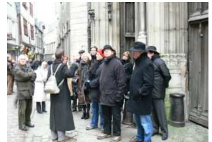
Rue St Romain devant la cour des Libraires

Au cours de ces deux heures, notre guide nous a proposé un parcours émaillé de monuments incontournables : la cathédrale puis l'évêché, l'église Saint Maclou, l'Aître Saint Maclou, le Palais de Justice, le Gros Horloge et enfin la place du Vieux Marché. Sans oublier une station devant la vitrine de la Faïencerie Augy rue Saint Romain.