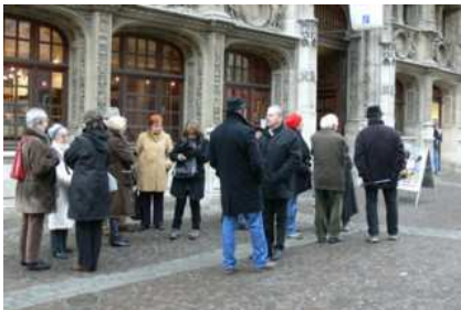
Devant l'Office de Tourisme

Samedi 11 décembre, nous nous sommes retrouvés à une quinzaine devant l'Office de tourisme de Rouen pour une visite guidée de la ville. Côté climat ce n'était pas la canicule, mais nous avons pu laisser les parapluies au vestiaire.